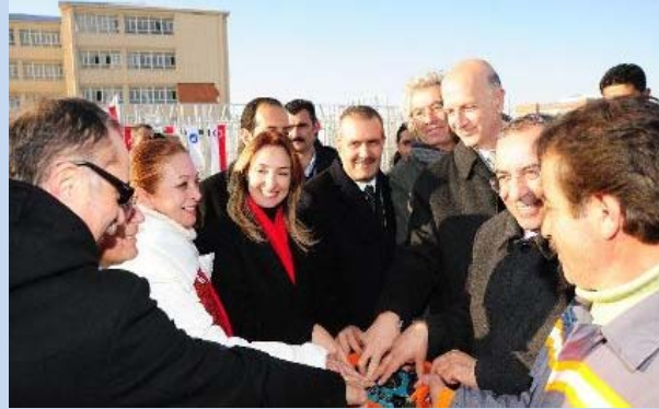
Rektörler, Vakıf yetkilileri ve milletvekilleri betoniyerin butonuna basarak temel atıyorlar.